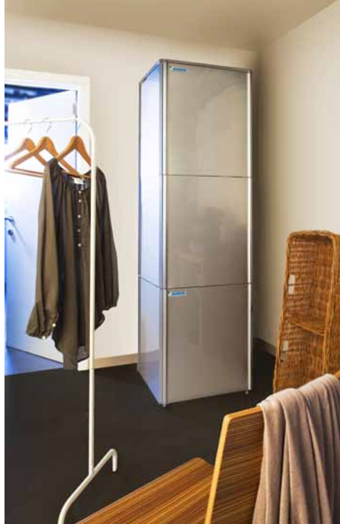
De binnenunit en sanitair warmwatertank kunnen op elkaar worden geplaatst.

Beschikbare vermogens: 11, 14 en 16 kW. Indien meer vermogen vereist is, kunt u voortaan meerdere binnenunits combineren met een enkele buitenunit tot een maximaal verwarmingsvermogen van 40 kW. De verwarmingsefficiëntie van een Daikin Altherma Hoge Temperatuur is drie keer groter dan een klassiek verwarmingssysteem op basis van fossiele brandstoffen of elektriciteit. De verwarmingskosten worden dan ook verlaagd terwijl u toch kan genieten van een stabiel en aangenaam comfortniveau.