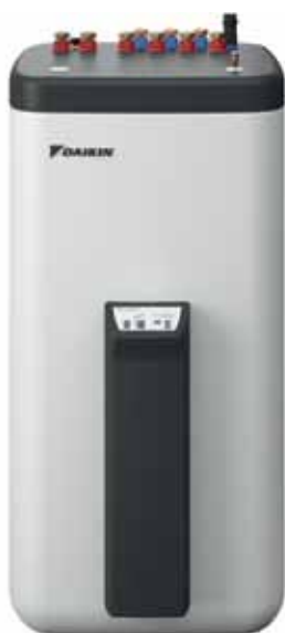
Daikin Altherma zonneboiler

Tot 80% van de zonne-energie kan omgezet worden in bruikbare warmte. De Daikin zonneboiler maakt gebruik van zonne-energie om warm water te produceren en eventueel de verwarming te ondersteunen. Als alle zonnewarmte niet onmiddellijk wordt gebruikt, kan de speciaal hiervoor ontworpen zonneboiler grote hoeveelheden zonne-warmte opslaan, die dan op een later tijdstip kunnen gebruikt worden. Dit kan een besparing tot 60% opleveren op de productiekost van sanitair warm water. De combinatie van zonnecollectoren en zonneboiler kunnen aangesloten worden zowel op de Daikin Altherma Lage Temperatuur als de Hoge Temperatuur, maar ook als een uitbreiding op een bestaand verwarmingssysteem.